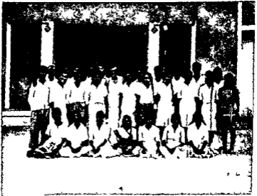
शांतिसेना शिविर, बहमदाबाद के शिविरार्थी